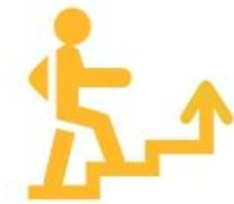
Логотип трека «Орлёнок – Лидер»

Ценности, значимые качества трека: дружба, команда